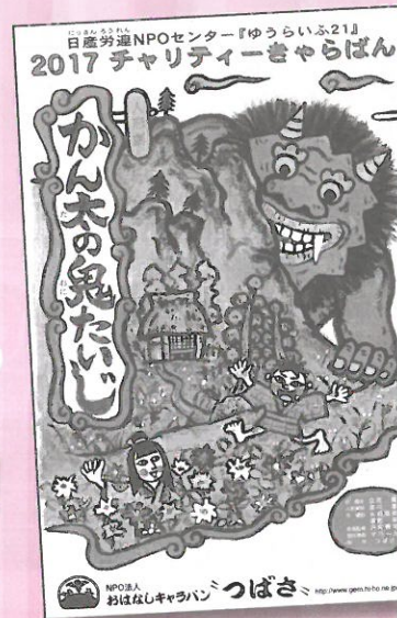
神奈川公演 4月26・27日